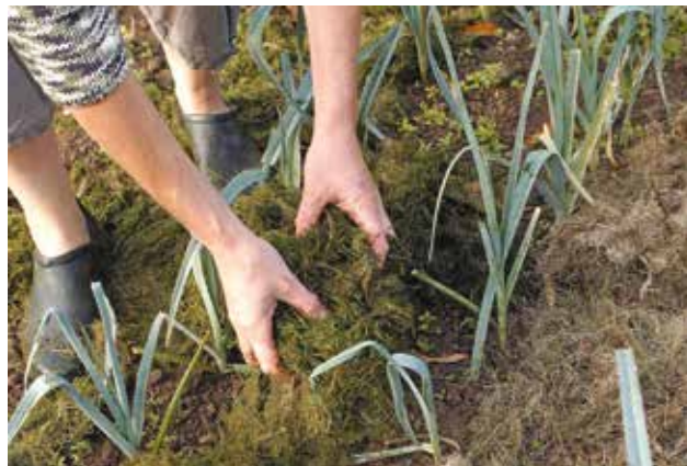
Pour pailler, on peut utiliser des tontes de pelouse, des feuilles mortes, des brindilles ou des déchets végétaux de cuisine.